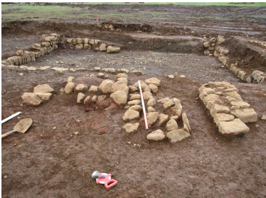
Mynd 6: Horft til norðurs yfir rústirnar á Svæði B

Svæðið sem opnað var er um 17,8 x 14 m að stærð. Eins var farið að hér og á Svæði A að notast var við skurðgröfu til að taka burt yfirborðslög og til að moka upp úr byggingu þeirri sem sást í SK2. Að loknum vélgrefttri stóð eftir niðurgrafin bygging um 8,4 x 7 m að stærð, með vönduðum hleðslum úr tilhöggnu grjóti. Er hún af flestu ef ekki öllu leyti með sama byggingarlagi og hlöðutóftin sem grafin var upp á Svæði A. Ástand veggjanna er þó öllu lakara og eru víða skörð í hleðslurnar. Samanstoð fyllingin í byggingunni af torfblönduðum jarðvegi og stóru tilhöggnu hleðslugrjóti. Austarlega, sunnavert við þessa byggingu fundust síðan óljósar leifar veggja úr torfi og grjóti ásamt nokkrum hrullögum sem virðast vera eftir byggingar sem sambyggðar voru niðurgrofnu rústinni. Virðast þær hafa staðið á sama yfirborði og grunnur niðurgrofnu byggingarinnar var grafinn niður úr. Syðst við austurvegg niðurgrofnu byggingarinnar var svo grafin fram stétt, lögð úr náttúrulegu grjóti sem einnig hafði sést í SK2. Engin ummerki eldri bygginga eða byggingastiga sáust undir þessum mannvirkjum. Nokkrir gripir fundust í fyllingu niðurgrofnu rústarinnar. Var um að ræða glerbrot, leirkersbrot, víðarleifar, og járnmoni af ýmsu tagi. Við hreinsun á gólfi byggingarinnar fannst síðan koparpeningur, n.t.t tvíeyringur, merktur Kristjáni 9. sem var konungur Danmerkur á árunum 1863-1906. Verður þessi fundur að teljast ágætis vísbending um aldur byggingarinnar og líklegt að hún sé a.m.k frá upphafi 20. aldar.