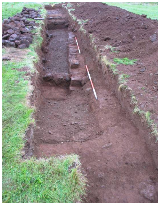
Mynd 3: Horft til austurs yfir SK2

Í SK2 fundust veggjarleifar hlaðnar úr tilhöggnu grjóti. Var um að ræða þrjá veggi, þe. einn langvegg sem fylgdi suðurhlíð skurðarins og tvo veggi sem gengu þvert á hann við sinn hvorn enda. Byggingarlag þessa mannvirkis virðist að mestu leiti svipað því sem sást í SK1. Virðist byggingin hafa verið niðurgráfin og sást móta fyrir húsgrunninum. Hafa veggirnir verið hlaðnir ofan í grunnin en síðan fyllt upp að þeim að utanverðu, ýmist með torfi eða möl. Virðist sem byggingin hafi verið fyllt af grjóti þegar sléttað var yfir hana og var mikið af