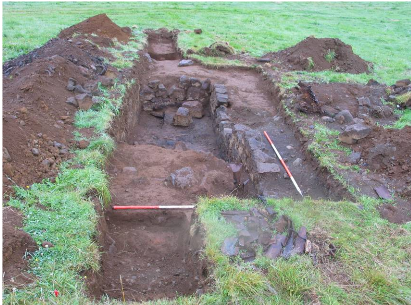
Mynd 2: Horft til suðurs yfir SK1

Í SK1 fundust veggjarleifar, hlaðnar úr tilhöggnu grjóti, auk greinilegs hruns úr veggjum. Virðist byggingin hafa verið niðurgrafin og sást móta fyrir húsgrunninum. Hafa veggirnir verið hlaðnir ofan í grunnin en síðan fyllt upp að þeim með mól að utanverðu. Einnig sást þykkt lífrænt lag í skurðinum líklega með eins og gjarnan safnast upp í skepnuhúsum, en þegar grafið var niður úr laginu var komið niður á náttúrulega mól. Samkvæmt túnakorti frá 1917 var útihús á þessum stað sem er um 140 m austur frá bæjarhólnum. Að sögn Guðmundar Magnússonar, sem fæddur er árið 1934 og búið hefur alla sína tíð í Leirvogstungu, mun hafa verið um að ræða tvö fjárhús og hesthús með sameiginlega hlöðu. Voru húsin sambyggð hlöðunni að sunnanverðu. Talsvert af gripum fannst í skurðinum, þ.e. keramikbrot, glerbrot, koparleifar, viðarleifar, járnleifar af ýmsum stærðum og gerðum, textíll, brýni ofl. Gripirnir virðast við fyrstu sýn flestir vera frá fyrri hluta 20. aldar en þó fæst ekki endanlega úr því skorðið fyrr en þeir hafa verið greindir af gripafræðingi. Verður