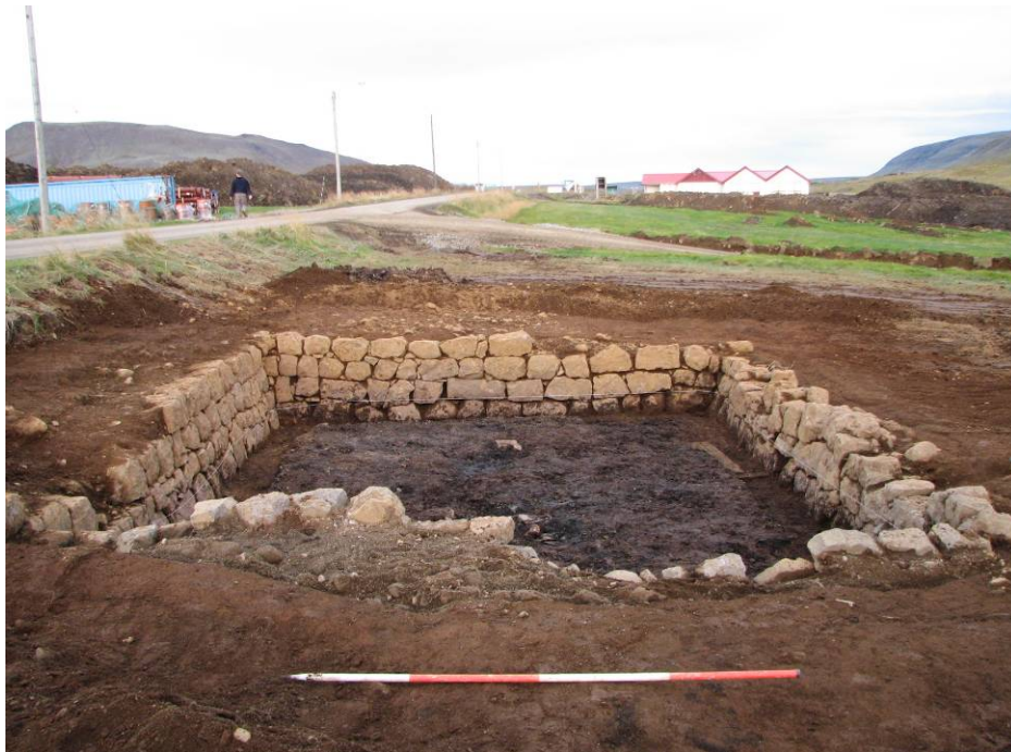
Mynd 5: Horft til austurs yfir rústina sem grafin var upp á Svæði A

Svæðið sem opnað var, var um 16x14 m að stærð og var notast við skurðgröfu til að taka burt yfirborðslög og að moka upp úr byggingu þeirri sem sást í SK1 Að loknum vélgræftri stóð eftir bygging með vönduðum veggjahleðslum úr tilhöggnu grjóti. Samanstóð fyllingin í byggingunni af torfblönduðum jarðvegi sem innihélt mikið af stóru tilhöggnu grjóti. Byggingin er um 7,6 x 5 m að stærð og liggur austur-vestur. Stendur hún í grunni sem er um 9 x 6,5 m að stærð og liggur austur vestur. Eins og ummál byggingarinnar gefur til kynna, þá fyllir hún ekki alveg út í grunninn og því er malafylling utanvert meðfram veggjum hennar. Eins og fram kom í umfjöllun um SK1 hér að