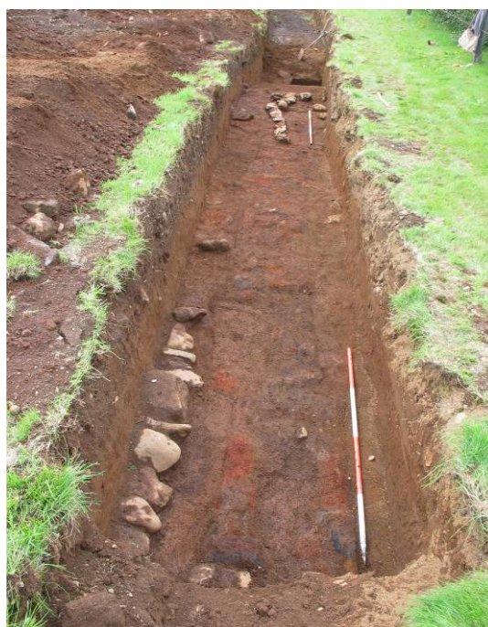
Mynd 4: Horft til vesturs yfir eystri hluta SK3

SK3 var grafinn norðanvert í núverandi bæjarstæði, norðan við fjós sem ábúendur telja að standi á eða við gamla bæjarhólinn. Í honum sást miklar leifar torf og grjóttveggja, auk öskulaga. Einnig fannst beinagrind af hesti, að því er virðist í heilu lagi. Nokkuð fannst af gripum í skurðinum, þ.e glerbrot, leirkersbrot, brýni, járn, textíll, leður viðarleifar, auk nokkurra dýrabeina. Er eins um þessa gripi og þá sem fundust í SK1 og SK2 að þeir virðast flestir vera frá fyrri hluta 20. aldar, en þó er ekki hægt að skera endanlega úr um það fyrr en þeir hafa verið greindir af gripafræðingi. Verður