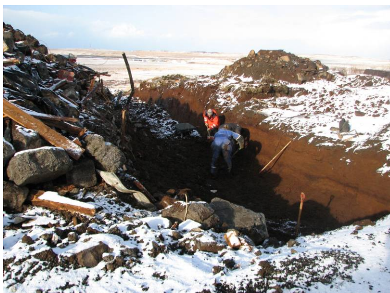
Mynd 2: Unnið að hreinsun á SK12 að loknum vélgræftri. Horft til vestnorðvesturs.

Eins og fram hefur komið var markmiðið upphaflega að hreinsa alveg upp grunn fjóssins og skrásetja allar minjar sem sæjust í botni hans, sem og sniðum. Vegna erfiðra aðstæðna reyndist ekki unnt að fjarlægja leifar fjóssins úr grunninum og því var brugðið á það ráð að grafa skurð