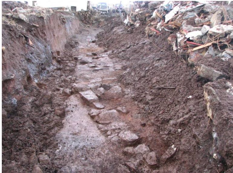
Mynd 3: SK12 að lokinni hreinsun. Vegghleðslurnar í vesturenda skurðarins eru í forgrunni fyrir miðri mynd

torfhlöðnu innra byrði, sem lá frá vestsuðvestri-austnorðausturs (sjá Mynd 3). Náði hún um 4 m inn í skurðinn frá vesturenda, en þar myndaði hún 90° horn á mótum öðrum vegg sem lá til suðausturs og hvarf sá veggur undir ruðning fjóssins eftir um 1 m. Austan