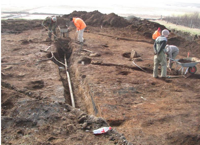
Mynd 6: Horft vestur eftir lagnaskurði sem liggur þvert í gegnum Svæði C