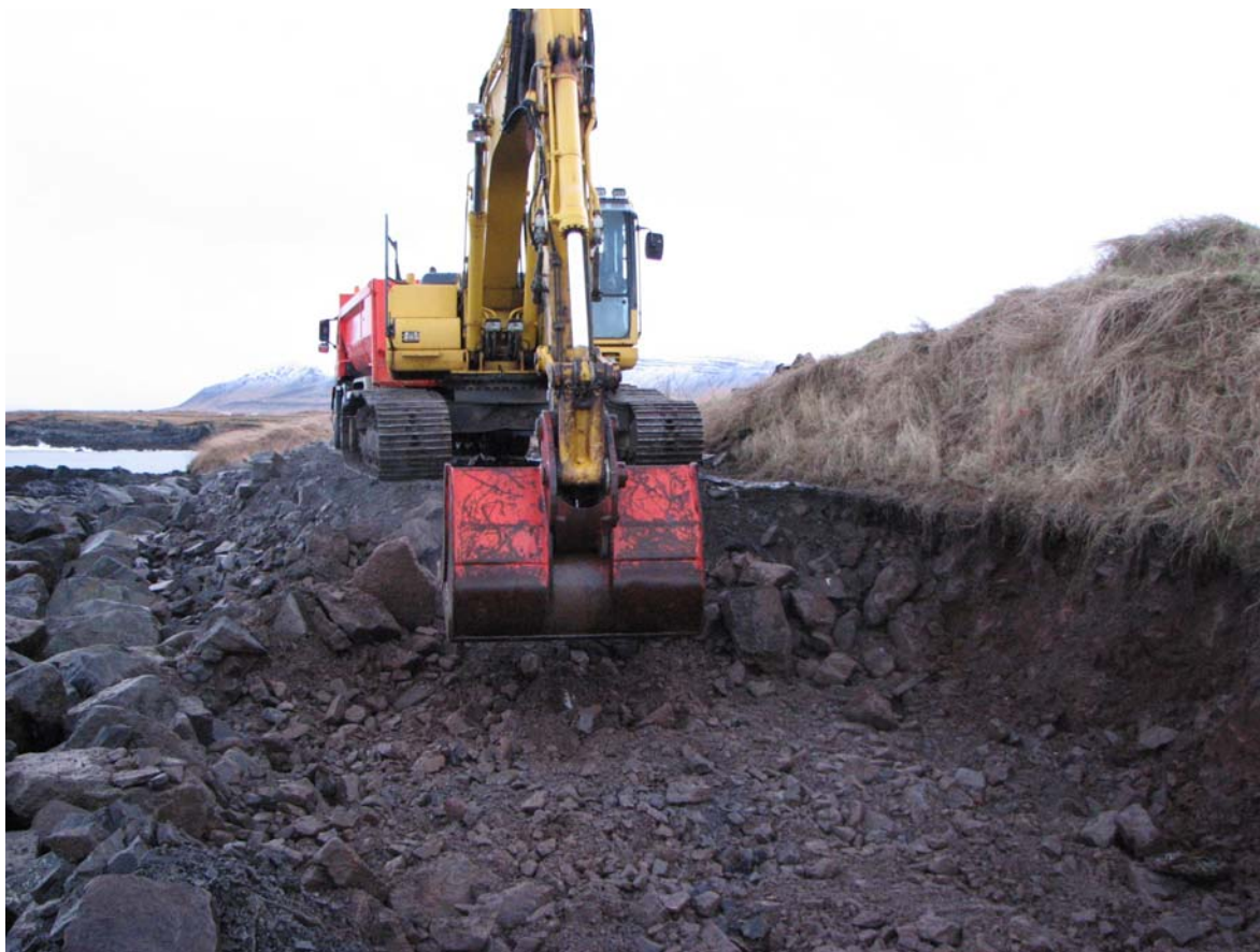
Mynd 5 Hér sést þegar verið var að fjarlægja malarstíginn.

Fyrirnefndur varnargarður og malarstígur voru gerðir nýlega þ.e. eftir 1998 þegar fornleifaskráning fór fram og hefur garðurinn varnað því að meira hafi brotnað af bæjarhólnum. Malarstígurinn reyndist nægilega breiður fyrir lagnaskurðinn og því þurfti ekki að hrófla við fornleifunum sjálfum við framkvæmdina nú.