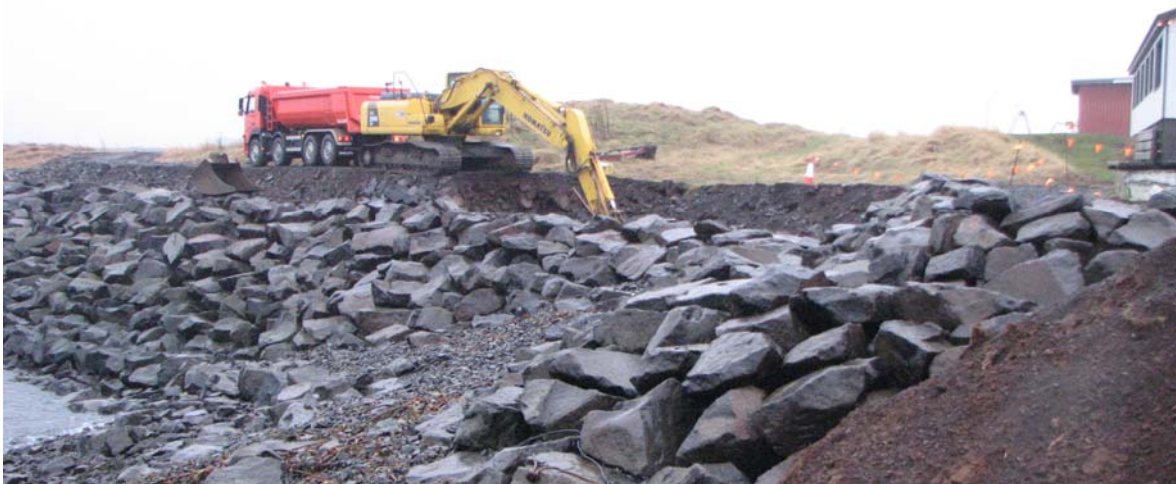
Mynd 4 Upphaf vélgrafter við bæjarhólinn.

Hóllinn stendur við vesturenda Kalmansvíkur. Farið er eftir Ægisbraut í norðvestur, út á enda og gengið í ASA, um 300 m. Grasi vaxinn hóll sem stendur í útjaðri byggðar og út á sjávarbakkannum. Rof er í bakkann. Allur vesturhluti túnsins, þ.e. túnið vestan og sunnan Presthúsabæjar, er horfinn undir nýbyggingar. Austurendi túnsins nær út að sjó yst í Kalmansvík og er það enn autt svæði. Göngustígur er þvert yfir hólinn og lítilsháttar rof þar í. 4