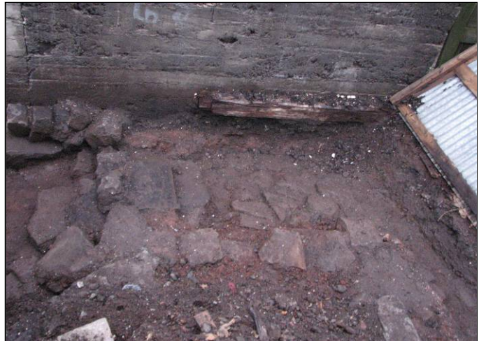
Mynd 5. Steinlögð stétt. Horft til N

Skurðurinn sem tekinn var í desember 2008 er á norður- og austurmörkum lóðarinnar, um 12,5 m á lengd N-S og að lágmarki 1 m á breidd. Norðan við uppstandandi hús á Vaktarabæjarlóðinni varð skurðurinn um 2 m á breidd og helgaðist það af minjunum, undirstöðu undir byggingu: u-laga grjóthleðsla sem opin er til vesturs (vesturhliðin gæti komið í ljós ef skurðurinn yrði grafinn lengra til vesturs). Inni í u-laga mannvirkinu – að sunnanverðu – var steinkolalag (brúnt á teikningu) þar sem fannst lítil kolaskófla. Norðan við kolalagið er svo ljósbrún mold með viðarkola- og skeljaleifum í (appelsínugult á teikningu). Þetta lag náði meira og minna yfir allan norðurhluta skurðarins og var lagið ekki grafið í burtu vegna mannvistarleifanna sem í því eru. Í norðausturhorni skurðarins – austan við u-laga hólfíð – er steinlögð stétt (rauð á teikningu) en á milli þessarra tveggja mannvirkja er upp- eða niðurstig hvar gengið hefur verið af stéttinni, ef að líkum lætur, og niður í hugsanlegan kolakjallara. Svo gæti vel verið að stéttin hafi verið undir þaki því hún situr býsna djúpt. Fast utan við (austan) er svo einföld steinaröð sem liggur samsíða skurðinum, N-S. Þessi steinaröð virðist vera lögð þétt upp að steinlögnum en er heldur lægri og því ekki úr vegi að álykta sem svo að um