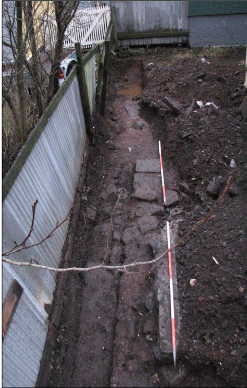
Mynd 3. Könnunarskurður, suðurhluti. Horft til S