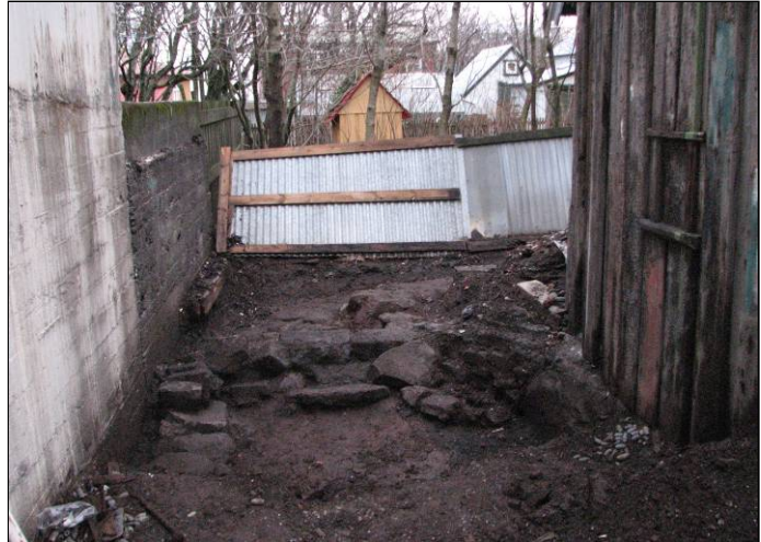
Mynd 4. U-laga mannvirki, undirstöður kjallara, og stéttin fjær. Horft til A