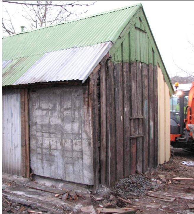
Mynd 1. Uppistandandi hús á Vaktaralóð, horft til SV